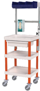
1003.06 + options