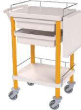
1003.07 + options