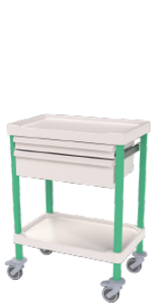
1003.01 OPI + 2 drawers