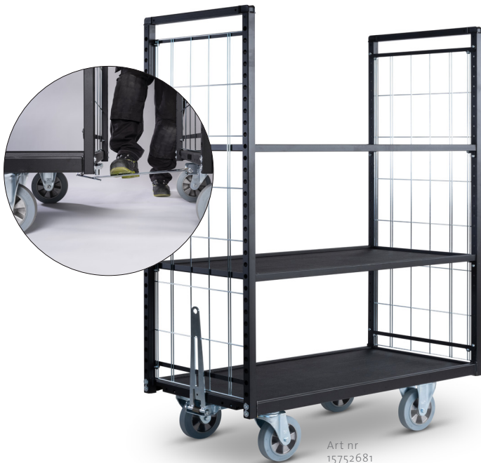
Art nr 15752681

Truckgaffelstyrning, bromsade hjul, hyllavdelare och extra hyllplan kan väljas till.