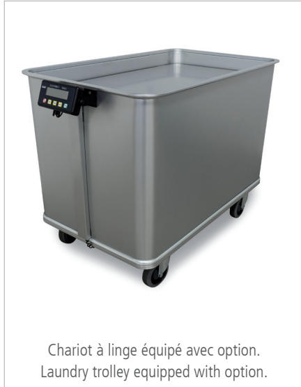
Chariot à linge équipé avec option. Laundry trolley equipped with option.