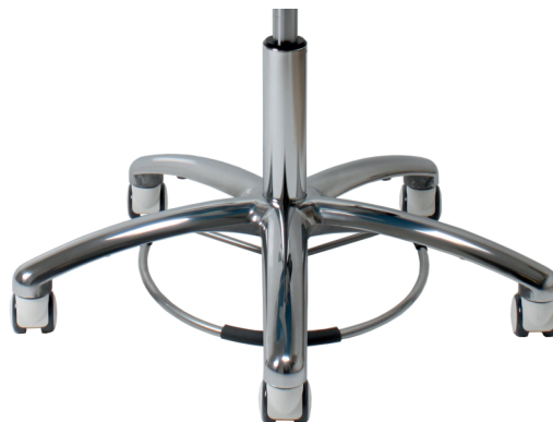
Stolen kan erhållas med fotkontroll

Alternativa hjul (tröga/belastningsbromsade/ fria vid belastning/antistatiska)